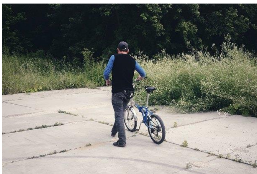
Велосипедист на берегу реки в радиоактивной зоне