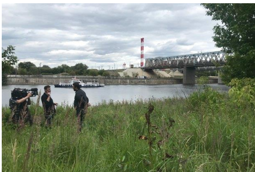
Сабуровский железнодорожный мост, рядом с которым пройдет хорда