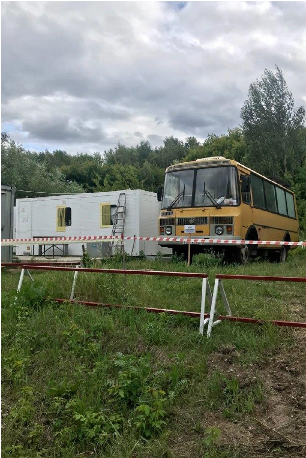
Пост «Радона», который убирает участок